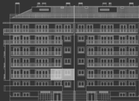
Alçado principal / Main elevation